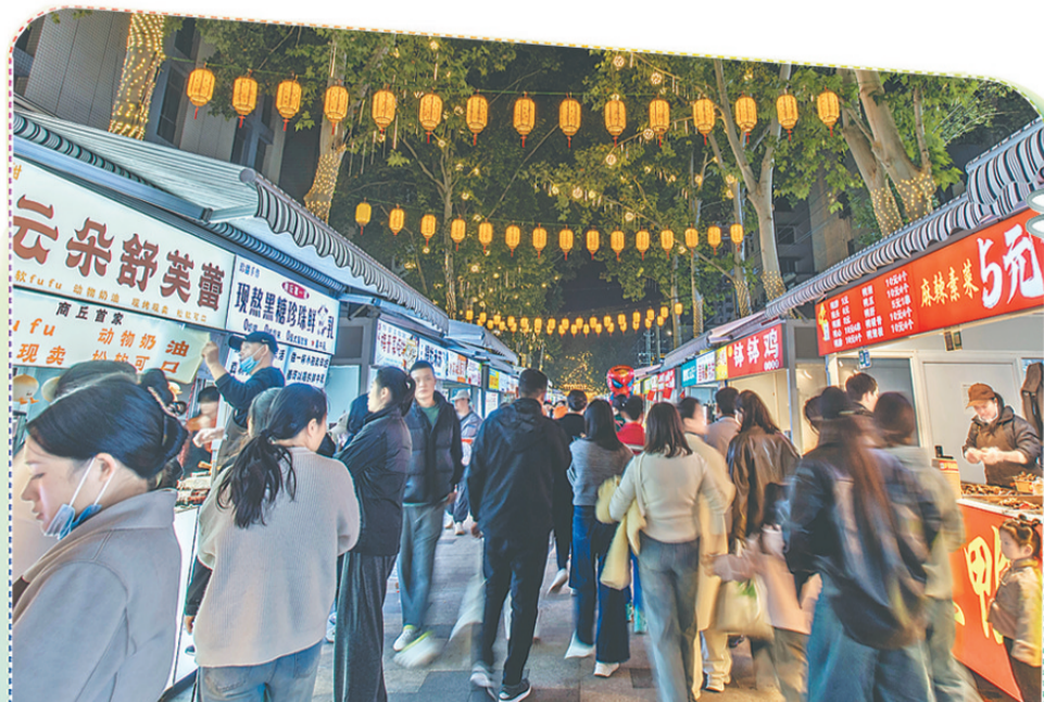
10 月 23 日晚，向阳路步行街人潮涌动。升级改造后的向阳路步行街环境得到明显改善，售卖亭规范统一，环境卫生整洁，客流量显著增加。

错峰游火热的市场背景下，市民不仅可以享受到更能融入生活的旅行体验，还能为旅游业的全面发展提供新的动力。各旅行社也在不断完善相关配套措施，致力于提升服务质量，加强与周边城市的联动互动，形成区域性错峰游的产品体系，以此提升旅游的吸引力。