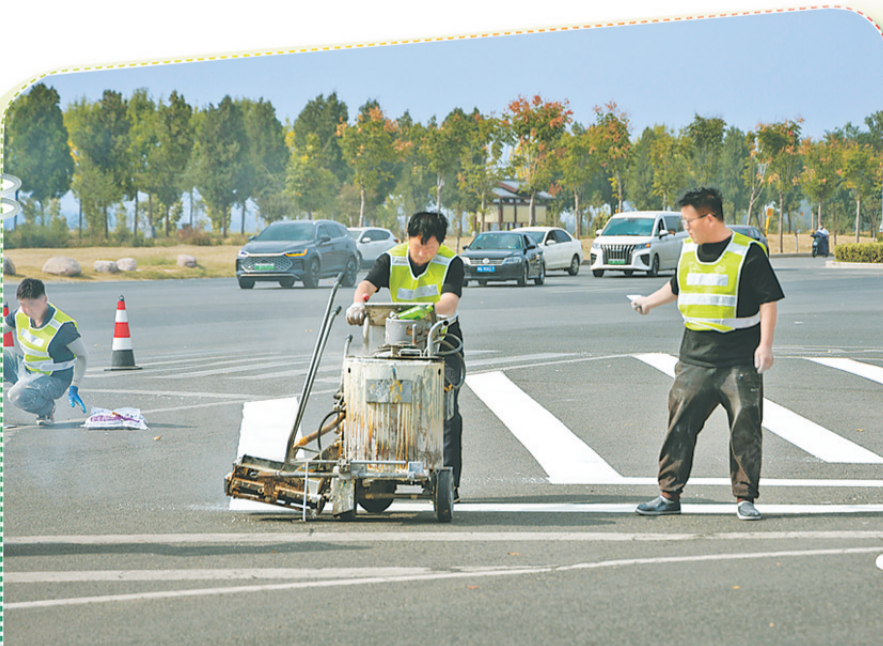
10 月 23 日，施工人员在北海路进行道路标线施工作业，对道路上存在模糊、缺失等问题的交通标线进行完善，消除道路交通安全隐患。