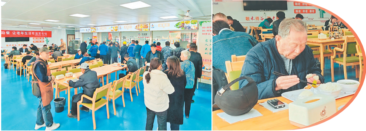
群众在老年食堂内排队选午餐。