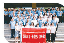
“壮丽75年·奋斗史诗复兴伟力”全媒体行进式主题报道