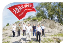
大美商丘调研行启动仪式

2022年是党的二十大召开之年，商丘日报推出“喜迎党的二十大·商丘非凡十年”大型全媒体系列报道，采用全域采集、全景报道、全媒呈现的方式，讲述党的十八大以来商丘各地贯彻新发展理念、构建新发展格局、推动高质量发展的生动实践。河南省委宣传部《河南新闻阅评》以《精心呈现奋斗历程着力讲好出彩故事》为题进行了专题阅评，评价系列报道气势恢宏、立意高远，传播视角多元、传播元素丰富。