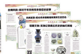
《应天大观园》栏目融媒体系列报道