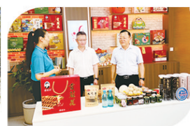
融媒体电商直播间