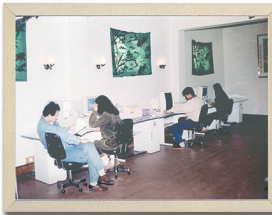
▲1993年，商丘日报社添置新华社地面卫星接收系统，采用激光照排技术，告别了铅与火，迎来了光与电。