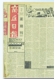
▲为了服务读者满足市场需求，报社创办了商丘日报星期刊和经济周末版。