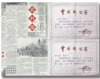
▲2000年4月13日商丘日报农村版第一版配图编发王玉华、余福灵采写的作品《生态失衡给人们带来麻烦，蜂蝶无处觅 忙煞众果农》一文，获第11届中国新闻奖。