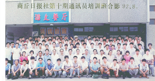
▲长期以来，报社坚持举办通讯员培训班，培养通讯员上万名。

京九沿线地报联谊会成立 【本报商丘讯】京九沿线地报联谊会，日前在商丘正式成立。该会是由京九沿线各省市地报、报社、新闻工作者自发组成的一个行业性组织。成立大会在商丘隆重举行，与会代表就加强沿线地报之间的交流与合作，共同提高新闻宣传水平，服务地方经济社会发展等议题进行了广泛讨论。商丘日报社作为发起单位，受到了与会代表的一致好评。