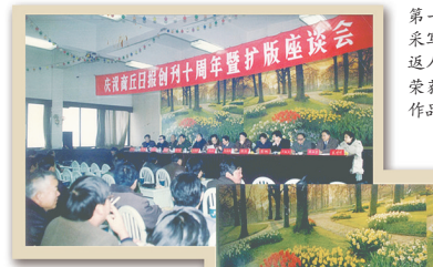
▲1994年12月，《商丘日报》创刊10周年暨扩版座谈会召开。省委宣传部副部长、原商丘地委宣传部部长兼《商丘日报》总编辑刘清惠，新华社河南分社社长赵德润，人民日报河南记者站站长李杰等与报社同志们座谈并合影留念。