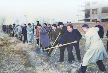
▲奠基仪式现场，大家挥锹铲土。

根植沃土，向上生长。进入20世纪90年代，商丘日报在唱响主旋律、打好主动仗的同时，着力于自身成长。1993年《商丘日报》改为周刊，实现了本地新闻天天见报；1994年春天，报社面向商丘地区公开招聘10名大学毕业生，充实到记者、编辑一线，为新闻事业的发展打下坚实的人才基础。1995年1月1日，《商丘日报》改为对开大报。为满足读者差异化需求，1993年创办了《商丘日报·星期刊》；1994年创办了《商丘日报·经济周末版》；1996年创办了《商丘日报·农村版》等一系列专刊特刊，增强了针对性，提高了有效阅读率。随着电脑激光照排技术、双色轮转机的使用和新闻采编网络的启用，《商丘日报》告别了“铅与火”时期，跨入“光与电”时代，科技为报社发展插上了腾飞翅膀。