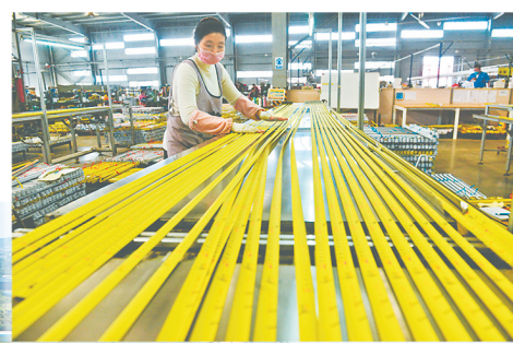
江华工量具有限公司工人在赶制订单