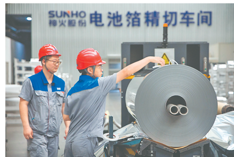
神火新材料科技有限公司工人在车间忙碌